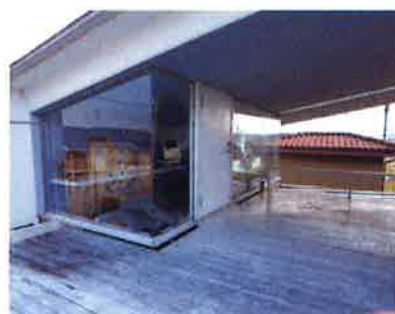
おしゃれなガラス張りロフトから つながる広いウッドデッキ